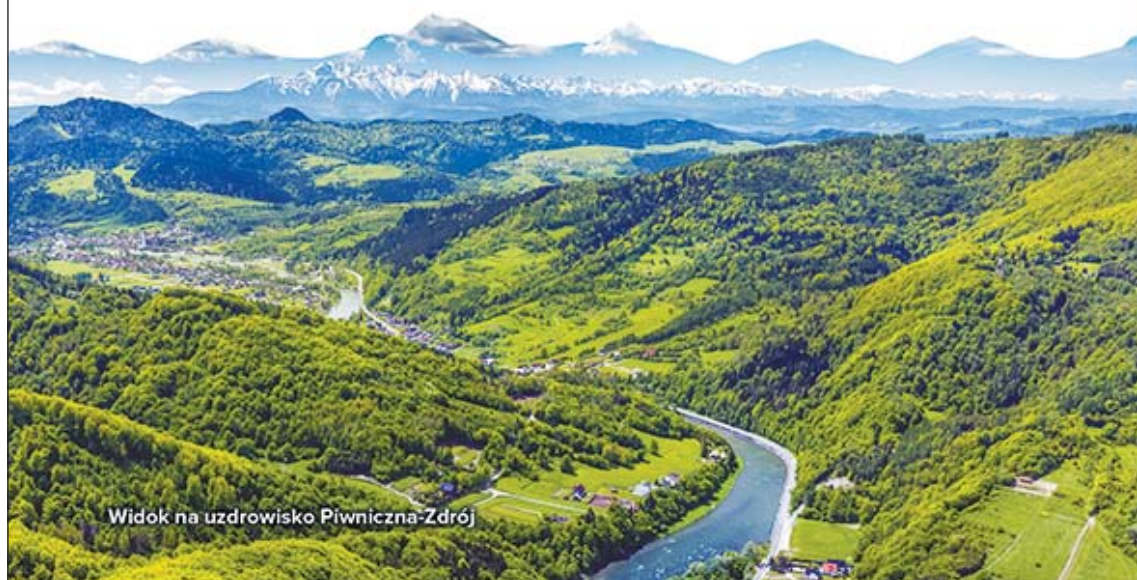
Widok na uzdrowisko Piwniczna-Zdrój